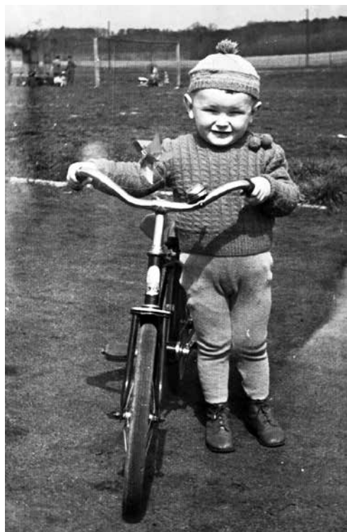
■ Czerwony rowerek – pierwszy wyścig