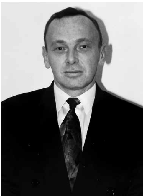
■ W dniu, gdy zostałem dyrektorem Teatru Polskiego Radia, rok 1992

Nic nie jest zbyt piękne, by nie mogło być prawdziwe. Żałuję, że nie potrafię żeglować, jeździć konno, wspinać się po górach. Żałuję, że nie byłem na równiku, na biegunach i przed Ścianą Płaczu w Jerozolimie, chociaż znam to miasto na pamięć. Najmądrzejsza starość jest gorsza od najgłępszej młodości. Gdybym spotkał siebie sprzed lat, nie powiedziałbym sobie ani słowa, bo i tak ten ktoś by mnie nie posłuchał. Albowiem ten ja to ktoś inny. Pogłaskałbym go po głowie z czułością, gdyż ja już wiem, przez co będzie musiał przejść. Czasami śnię o pewnej lipcowej niedzieli, kiedy jadę na rowerze i niczego się nie boję. Śnię też o tym, że dzwonię do Mamy