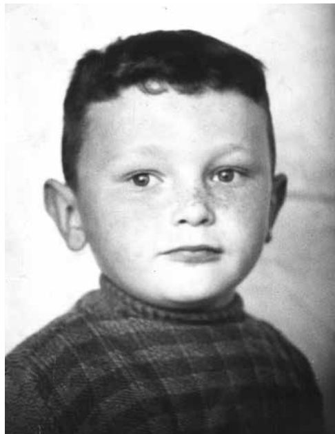
■ Dzieciństwo – pierwsze zdjęcie

aż tak wysoko, a perspektywa za oknem okazała się krótka, sięgająca może stu, może dwustu kroków dorosłego człowieka... Nie zmniejszyło to jednak mojego wzruszenia!... Usiadłem na chwilę, w ciszy, w zadumie, i przypomniałem sobie wyraźnie te wszystkie spędzone tu godziny, a było ich tak wiele, wręcz setki... Musiałem – uznałem sam przed sobą (co zresztą potwierdza się we wspomnieniach innych osób z mojej rodziny) – być dzieckiem bardzo spokojnym i cierpliwym. Niewykluczono, iż byłem dotknięty jakąś formą autyzmu. W tamtych czasach nikt o tym jeszcze nie słyszał i takim zjawiskiem psychologii dziecięcej wcale się nie przejmował.