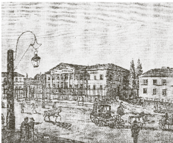
Dawny gmach mennicy przy ulicy Bielańskiej w Warszawie

stolicy, tym razem Księstwa Warszawskiego. Nowo wyznaczony twór, formalnie niezależny, podporządkowany był Napoleonowi, a władcą Księstwa został na mocy unii personalnej z Saksonią monarcha saski Fryderyk August I. Ta namiastka państwa polskiego nie przetrwała długo. Już w styczniu 1813 roku Księstwo Warszawskie zajęły wojska rosyjskie, a w roku 1815 w myśl postanowień kongresu wiedeńskiego zostało ono zlikwidowane. Z większości jego terytorium utworzono Królestwo Polskie.