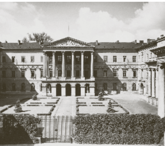
Pałac KRZPiS przed 1939 r.