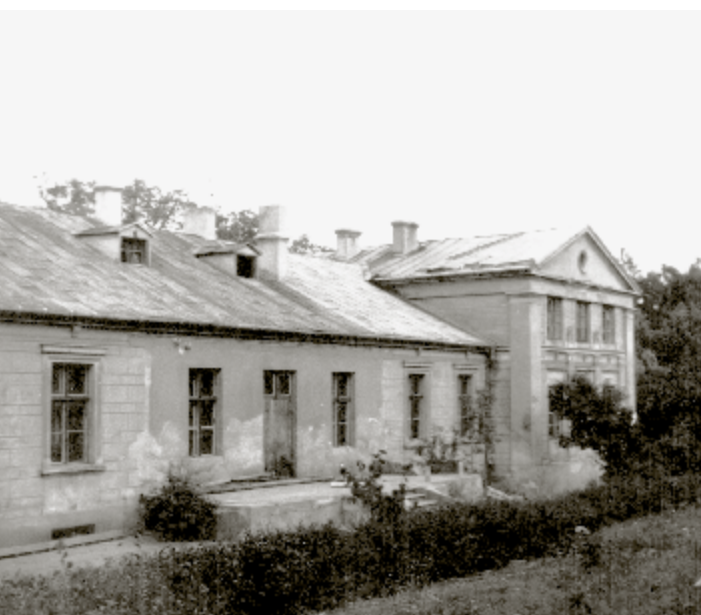
Dwór w Baruchowie po drugiej wojnie światowej